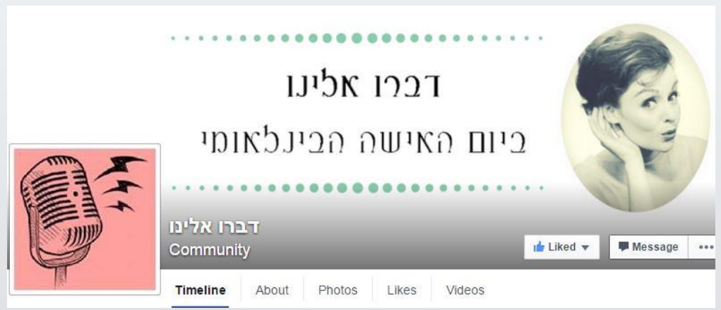
The first Facebook page design

Government SAT exam with an article I wrote about GIL